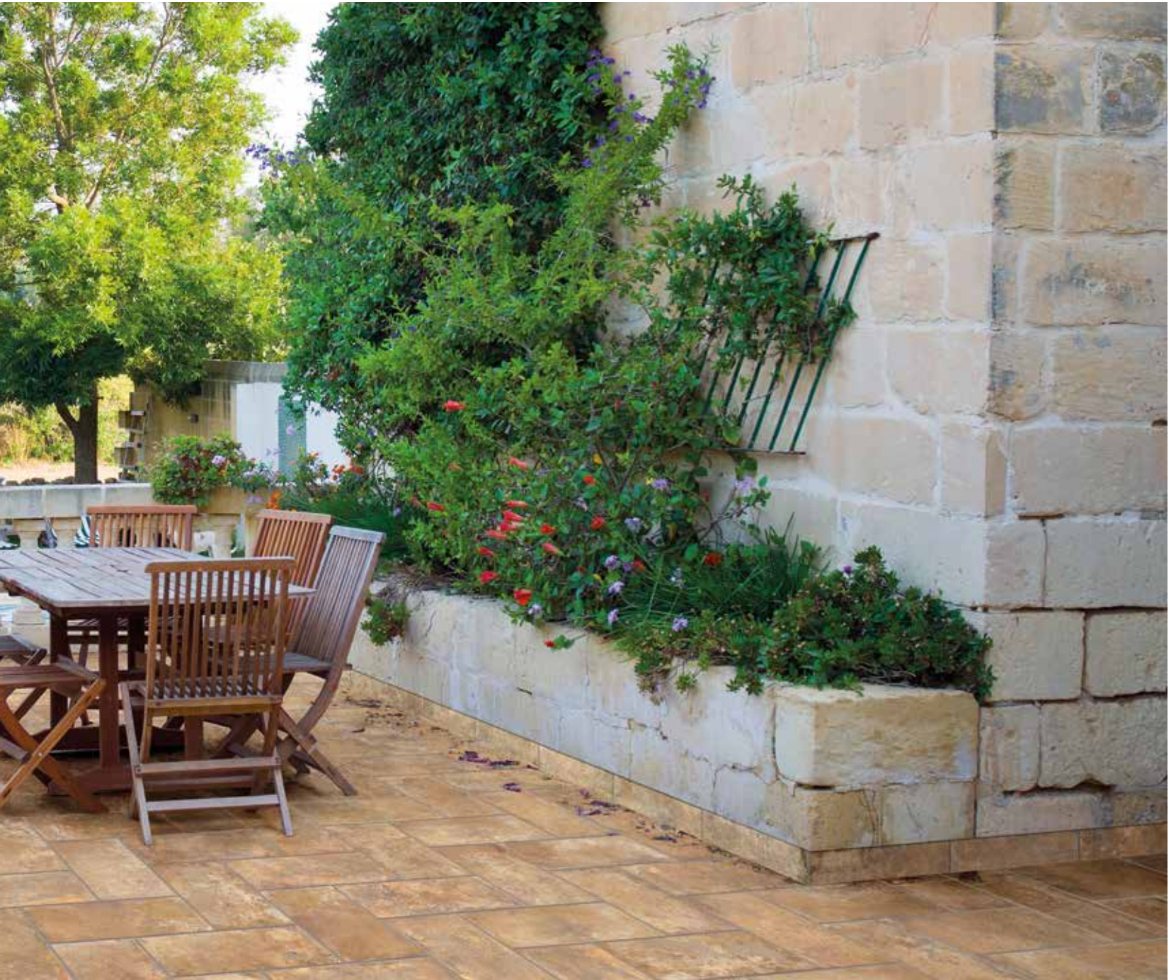
TAVELLONE TERRE D'UMBRIA