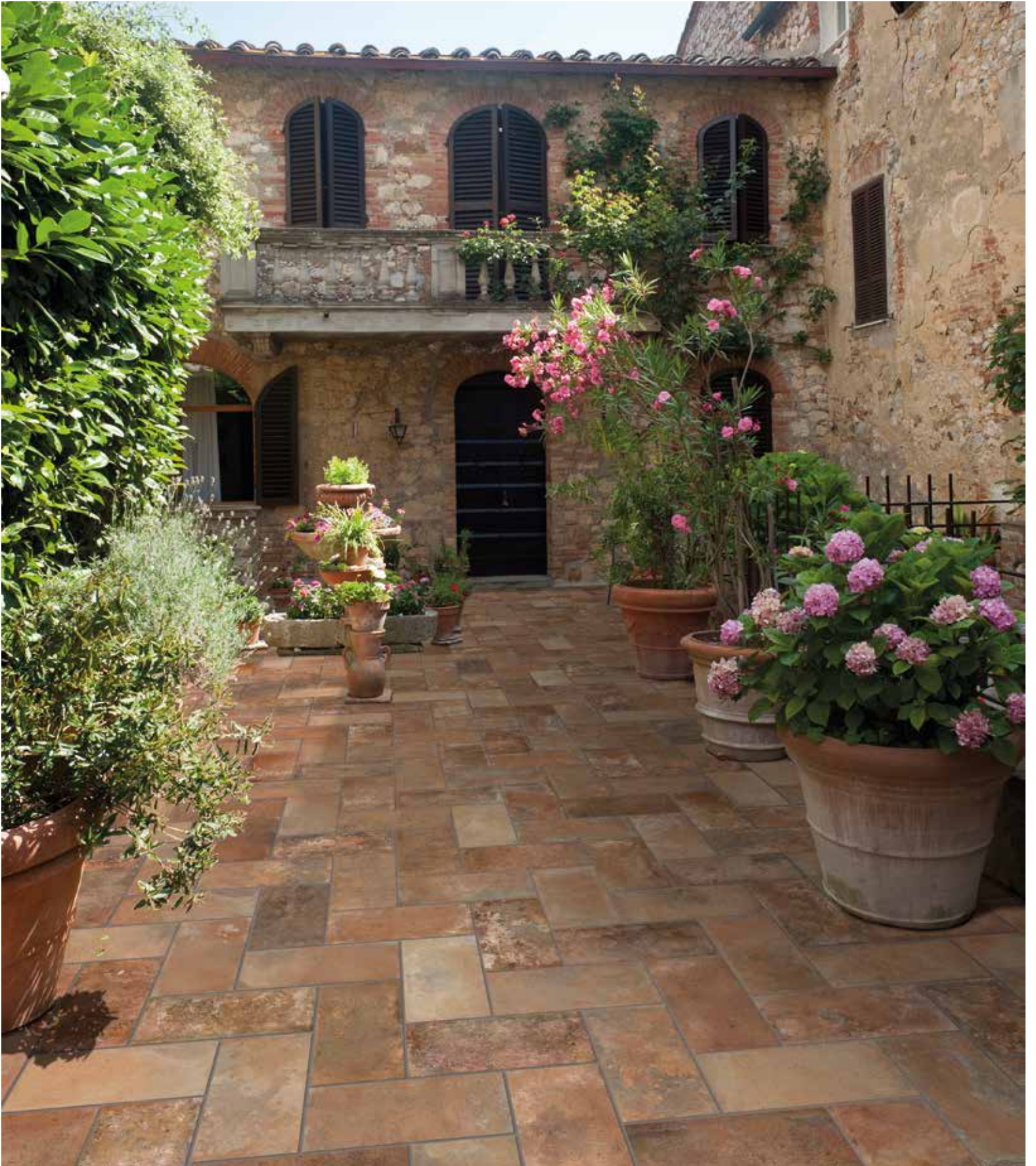
TAVELLONE VECCHIA FIRENZE