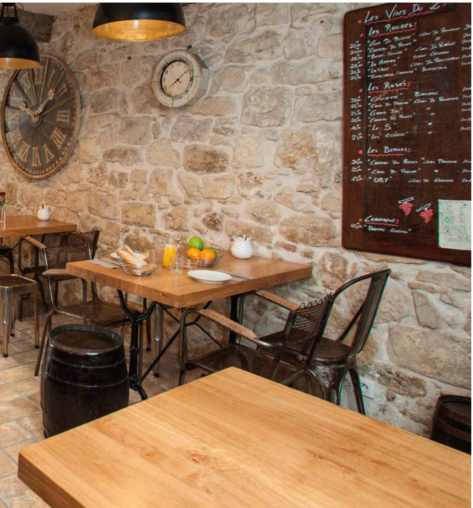
TAVELLONE TERRE D'UMBRIA